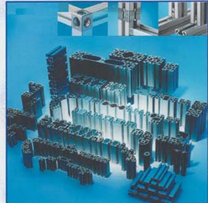
Profili di alluminio ed accessori Aluminium profiles and accessories