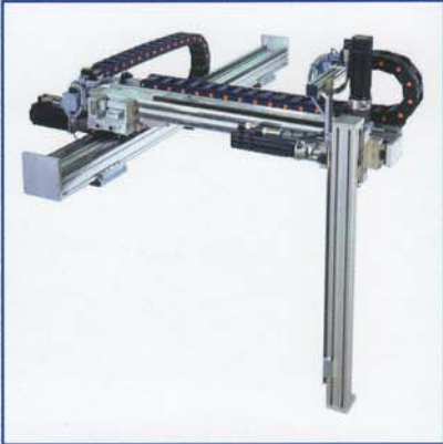
Sistema cartesiano a 3 assi 3 axis cartesian system