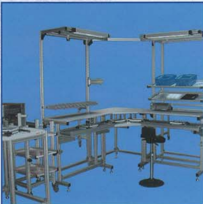
Postazioni di lavoro Manual workstations