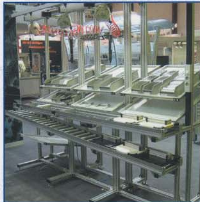
Concatenamento sistemi di produzione manuale Manual production systems