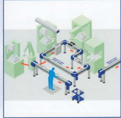
Sistemi di trasporto automatici Automatic transfer systems